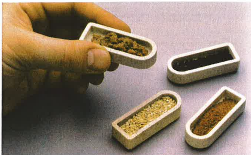
3 Verbrennungsschiffchen zur Aufnahme von festen oder flüssigen Proben.

\text{CO}_2 und \text{SO}_2 abgebunden, sodass nur noch Helium und \text{N}_2 im Trägergas vorhanden ist. Der Stickstoff wird schließlich mit einer WLD-Zelle gemessen.